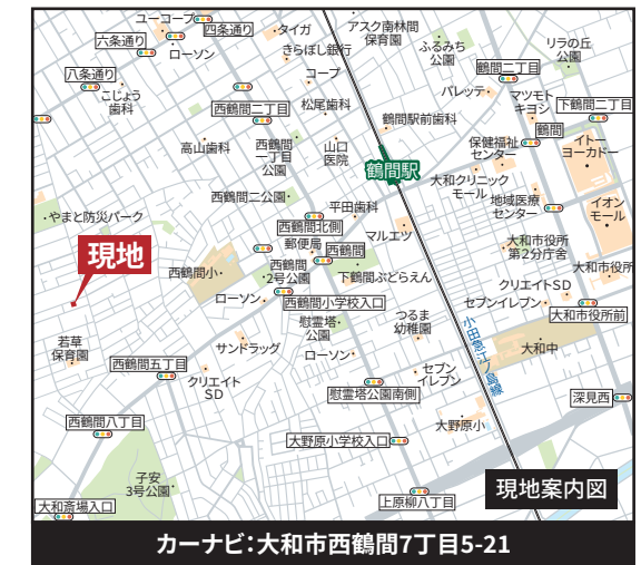
カーナビ:大和市西鶴間7丁目5-21

【物件概要】■所在地／(地番)神奈川県大和市西鶴間七丁目3608番16(住所)神奈川県大和市西鶴間7丁目5以下未定■交通／小田急江ノ島線「鶴間」駅徒歩15分、相鉄本線・小田急江ノ島線「大和」駅バス13～15分「水道局前」停 徒歩13分■土地面積／158.29㎡(47.88坪)■地目／宅地■都市計画／市街化区域■用途地域／第1種低層住居専用地域■建ぺい率／50%■容積率／80%■権利／所有権■その他法令上の制限／景観法、準防火地域、絶対高さ制限10M■総区画数／全1区画■販売区画数／今回販売1区画■販売価格／3,800万円■現況／更地■設備／東京電力・公営水道・本下水・都市ガス■接道状況／北西側約4.0M公道■備考／※図面と現況に相違がある場合は現況優先にてご了承下さい。